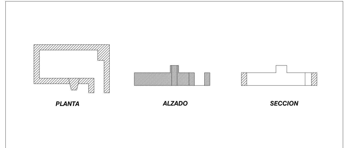
ESQUEMA DE PUNTO DE OBSERVACION