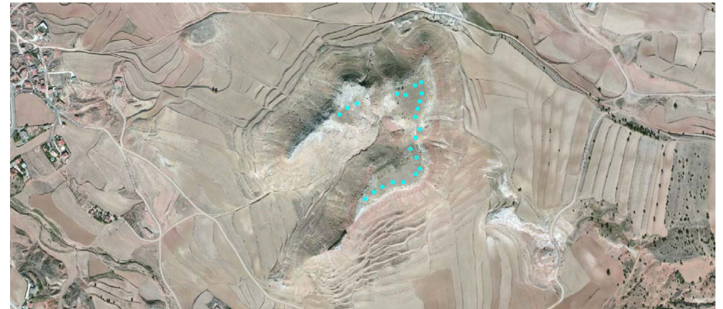
VISTA AMPLIADA DEL EMPLAZAMIENTO